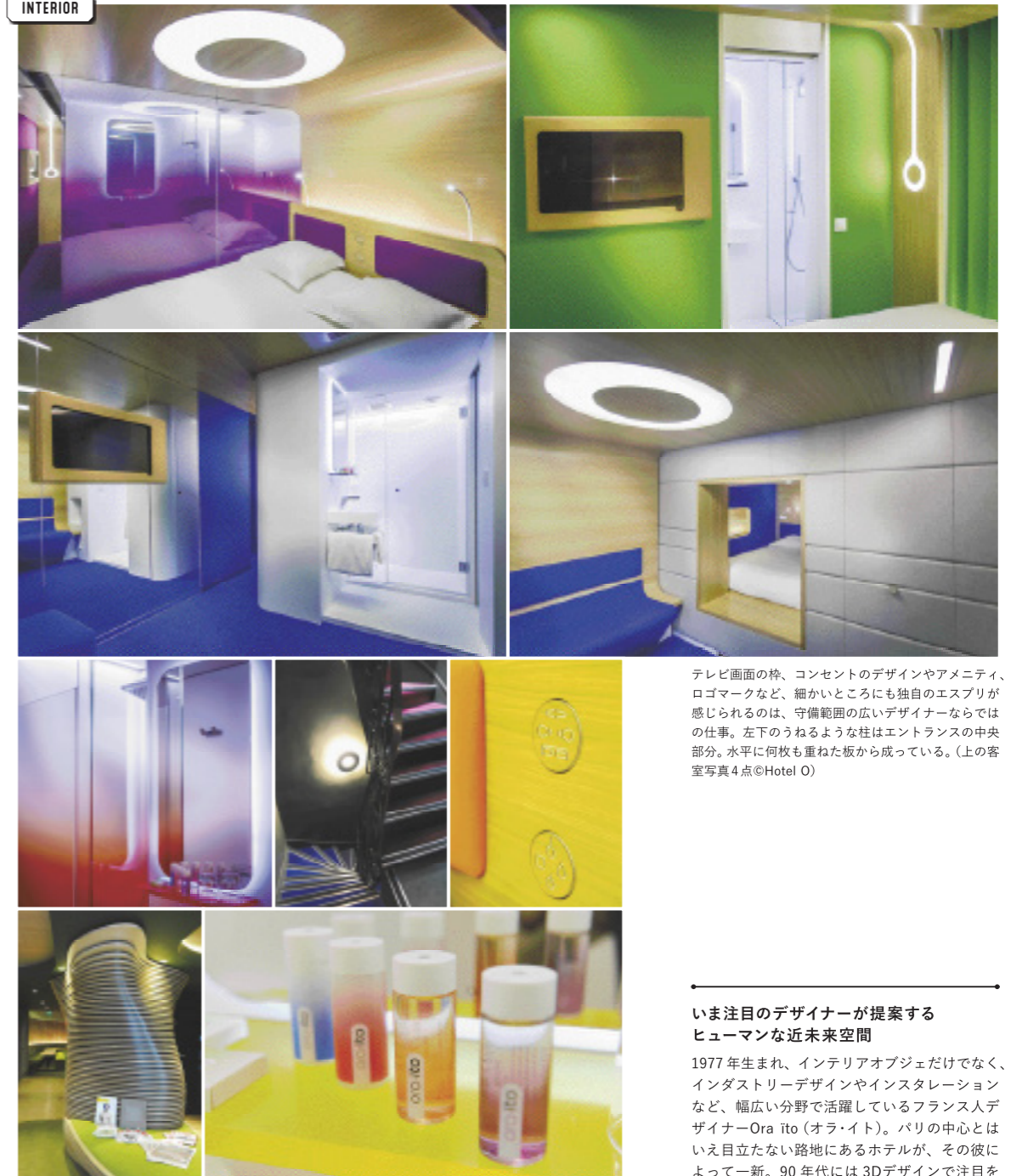
テレビ画面の枠、コンセントのデザインやアメニティ、ロゴマークなど、細かいところにも独自のエスプリが感じられるのは、守備範囲の広いデザイナーならではの仕事。左下のうねるような柱はエントランスの中央部分。水平に何枚も重ねた板から成っている。