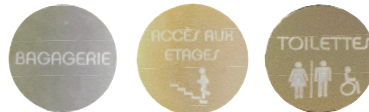
パブリックスペースの案内は、メタルを丸くカットしたモチーフで統一してある。書体にもまた丸みを帯びたものを採用。